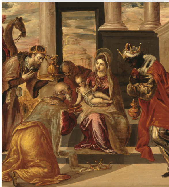
© Von El Greco, Gemeinfrei, https://commons.wikimedia.org